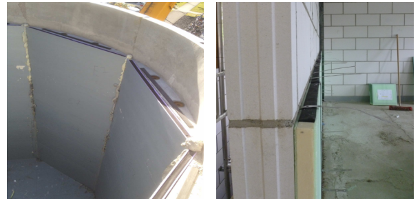
Deckeninnendämmung: Beispiel Detail 4.8.